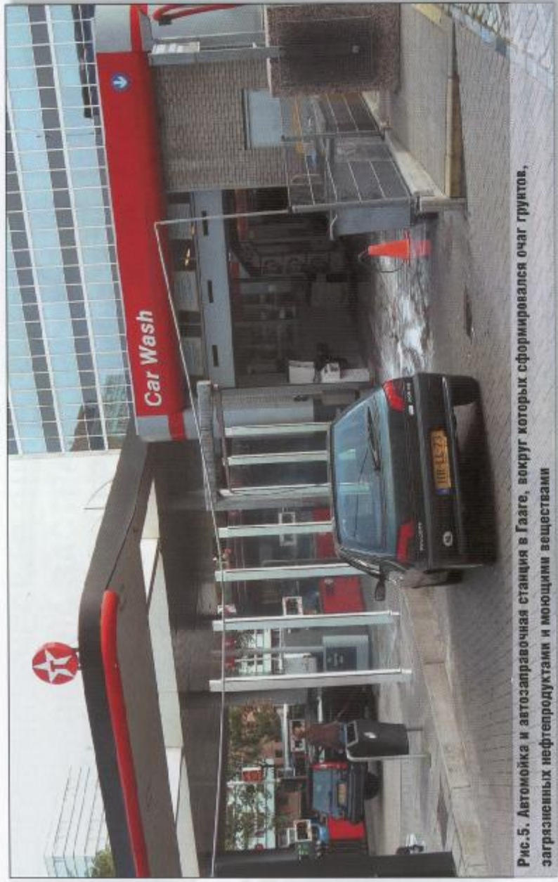
Рис. 5. Автомойка и автозаправочная станция в Гааге, вокруг которых сформировался очаг грунтов, загрязненных нефтепродуктами и мощными веществами

том. В разных вариантах применяются схемы с промывкой массива (подачи в анодные скважины анолита — выщелачивающей жидкости) или без промывки. Выщелачивающий водный раствор подбирается индивидуально в зависимости от типа загрязнителя и состава грунта. Технология применяется для всех видов дисперсных грунтов, особенно глинистых, и позволяет очищать массив от любых полярных загрязнителей (тяжелые металлы, органика, фенолы, спирты, радионуклиды и т.п.).