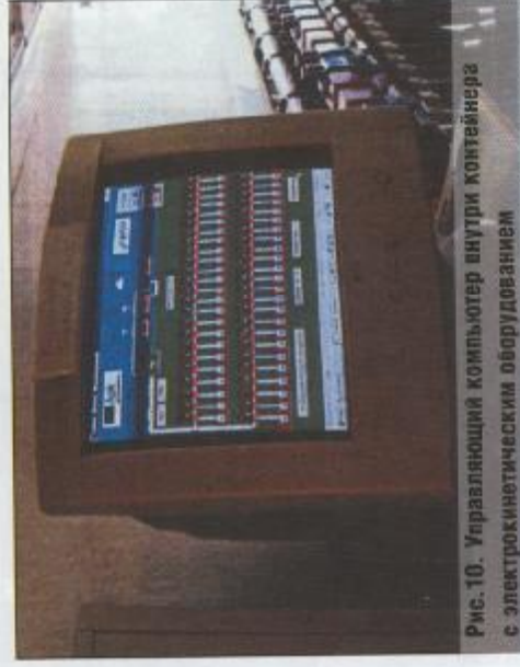
Рис. 10. Управляющий компьютер внутри контейнера с электрокинетическим оборудованием