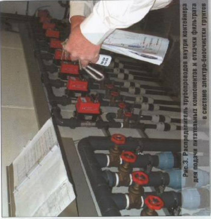
Рис.3. Распределитель трубопроводов внутри контейнера для подачи питательных компонентов и откочки фильтра в системе электро-биоочистки грунтов

нов) совместно с голландской компанией Holland Milieutechniek выполняет проекты по очистке грунтов от различных загрязнений без вывозки грунта (in situ). Работа российской и голландской компаний проводится в соответствии с соглашением между ними о разделе их функций. В активе голландской стороны десятки уже реализованных проектов по очистке грунтов как в Нидерландах, так и за рубежом (Япония, Китай и др.), выполненные за последние 15 лет.