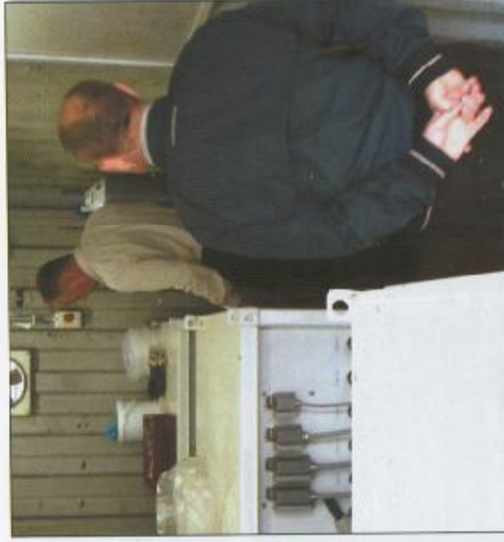
Рис. 9 а, б. Внутренний вид контейнера 6-электрокинетическим оборудованием для очистки грунтов от нефтепродуктов в Гаго

очистено свыше 5,5 тыс. м 3 грунтов, загрязненных асбестом. В этих проектах применялись различные варианты технологий электрокинетической очистки: электро-биоочистка, электроочистка с промывкой (выщелачиванием) и без и т.п.