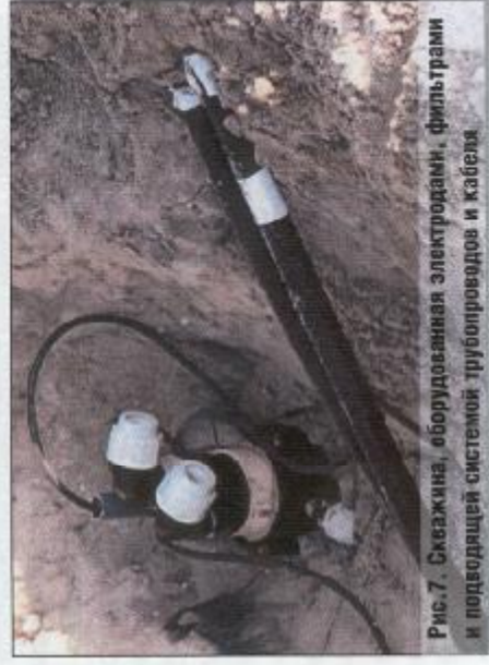
Рис. 7. Скважина, оборудованная электродами, фильтрами и подводящей системой трубопроводов и кабеля

Некоторые примеры реализованных проектов в Нидерландах представлены на нижеследующих фотографиях. Первый объект, с которым знакомился автор, располагался на уже застроенной территории Гаагского университета (рис. 1). Проведенные эколого-геохимические обследования выявили на территории университета значительный очаг техногенного загрязнения грунтов зсны азрации нефтепродуктами и ароматическими соединениями. Поскольку граница загрязненных грунтов подошла вплотную к зданиям университета, то о выемке грунта не могло быть и речи. В условиях плотной застройки на всей загрязненной территории университета была применена технология электро-биоочистки и размещена система анодных и катодных скважин, соединенных в анодную и катодную системы кабелем и