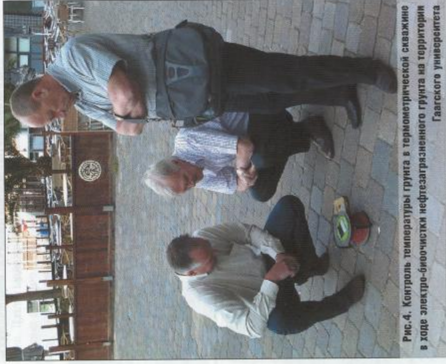
Рис.4. Контроль температуры грунта в термометрической скважине в ходе электро-биоочистки нефтезагрязненного грунта на территории Гаагского университета

2) Электрокинетическая очистка — применение рядов скважин, выполняющих роль катодов и анодов, для создания поля постоянного электрического напряжения в очищаемом массиве грунта. В этом поле полярные (заряженные) загрязнители мигрируют к электродам в поровом пространстве грунта и извлекаются в сепаратор с откачиваемым фильтратом.