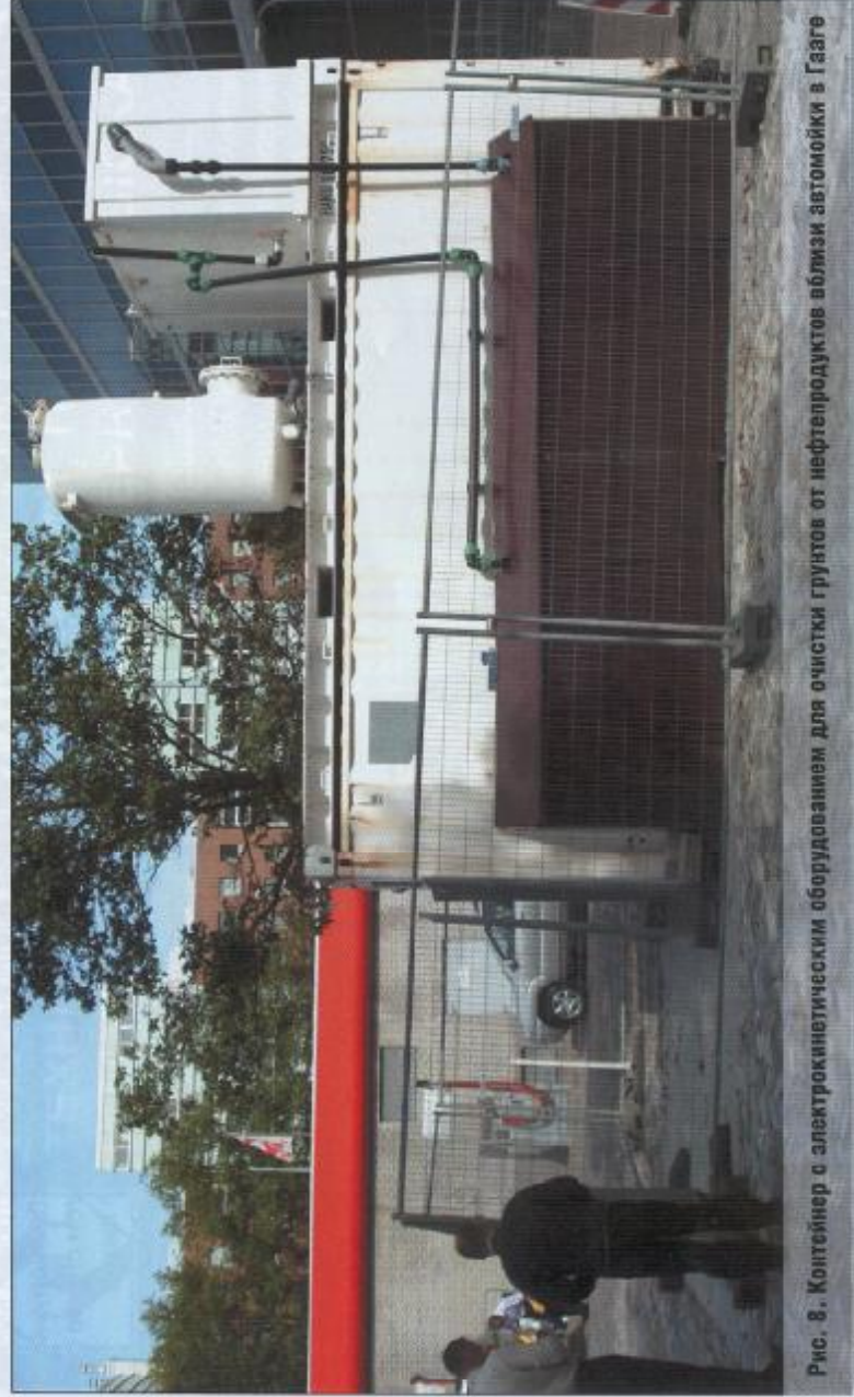
Рис. 8. Контейнер с электрокинетическим оборудованием для очистки грунтов от нефтепродуктов вблизи автотойки в Гааге

Проекты по очистке грунтов от различных тяжелых металлов (меди, свинца, цинка, кадмия и др.), мышьяка и трианидов были реализованы в Гронингене, Дельфте, Воендрехте, Штадсканаале (очищено свыше 2,5 тыс. м 3 ), Оостбурге, Утрехте, Гааге и др. городах Нидерландов. Грунты, загрязненные нефтепродуктами, ароматическими углеводородами, были очищены на территориях таких городов как Гаага, Лейден, Ворден (свыше 5 тыс. м 3 ), Амстердам, Маслуис (свыше 1,5 тыс. м 3 ), Шайк (ок. 3,5 тыс. м 3 ), Аппелроорн (свыше 9 тыс. м 3 ), Дордрехт, Маасдарм (свыше 9 тыс. м 3 ), Хорст (5 тыс. м 3 ), Дельфт (9 тыс. м 3 ) и др. Проекты по очистке грунтов, загрязненных токсичными хлорорганическими соединениями, были реализованы в Ниувпорте (около 7,7 тыс. м 3 ) Ассене, Гааге, Цейсте (7,2 тыс. м 3 ), Гронингене, Эйндховене (свыше 2 тыс. м 3 и 200 тыс. м 3 подземных вод), Амстердаме и др. городах. В г.Эйндсхеде было