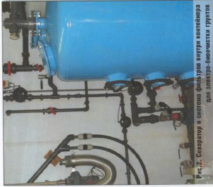
Рис.2. Сепаратор и система фильтров внутри контейнера для электро-биоочистки грунтов