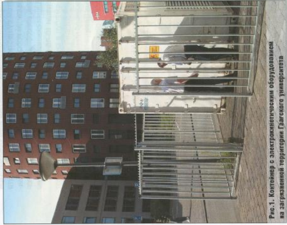
Рис.1. Контейнер с электрокинетическим оборудованием на загрязненной территории Гагского университета